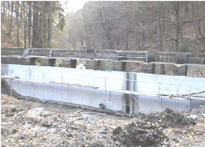
Sanierung der Staumauer 2004

Mit dem Neubau eines Teiles der Steganlage, sowie der Gestaltung des Vorplatzes am See, wurden im Jahr 2007 weitere Baumaßnahmen abgeschlossen.