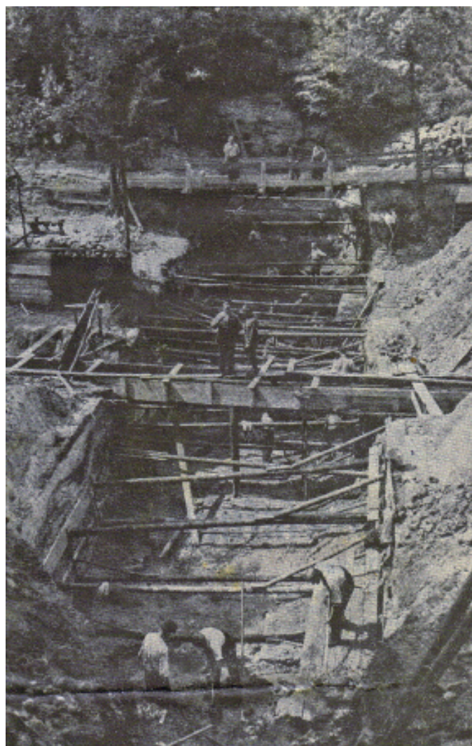
Baugrubensohle der Sperrmauer mit einer Tiefe bis zu 6.50 m

Der Bau der Amselseestaumauer wurde 1934 ohne wasserpolizeiliche Genehmigung begonnen. Die Amtshauptmannschaft Pirna fordert, mit Schreiben vom 26. Juli 1934, die Gemeinde auf, alle Bauarbeiten, außer denjenigen zur Freilegung des Untergrundes (der Baugrubensohle), sofort einzustellen.