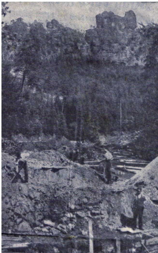
Baumfällarbeiten und Baugrubenaushub

Zum ersten Spatenstich der Sperrmauer im Amselgrund und zu Hebung des Amselgrundweges lud Bürgermeister Winkler am 21.7. 1934 für 9 Uhr ein.