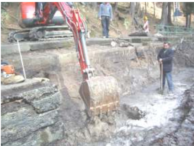
Neubau des Bootsanlegers Frühjahr 2007

Im Jahr 2003 wurde die Kurortentwicklungsplanung der Gemeinde fortgeschrieben. Einen Schwerpunkt bildet darin der weitere Ausbau des touristischen Wanderweges am Amselsee. Der Gemeinderat hat deshalb für die Jahre 07/08/09 Haushaltsmittel für den Neubau der Stützwand, Geländer und für den Wegebau eingeplant. Entsprechende Fördermittelanträge sind gestellt. Baubeginn dieser Maßnahme war der 1. Oktober im Jahr 2007.